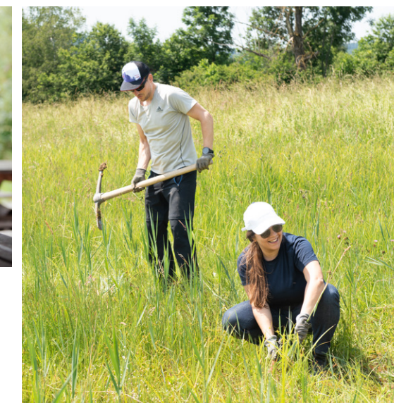
Gruppenführung (oben) Mieten für stimmungsvolle Anlässe (links) Corporate Volunteering (rechts)